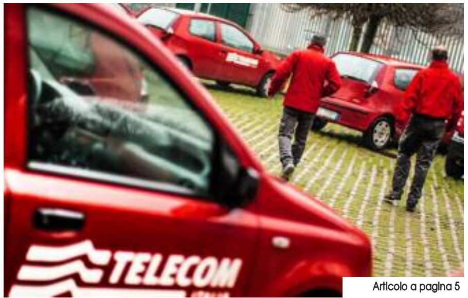
Articolo a pagina 5